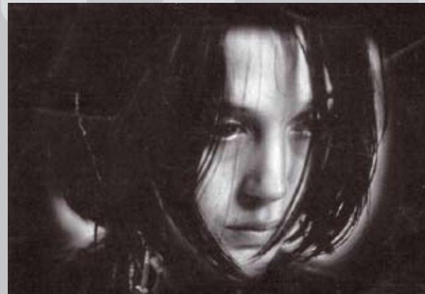
Seule , 1996