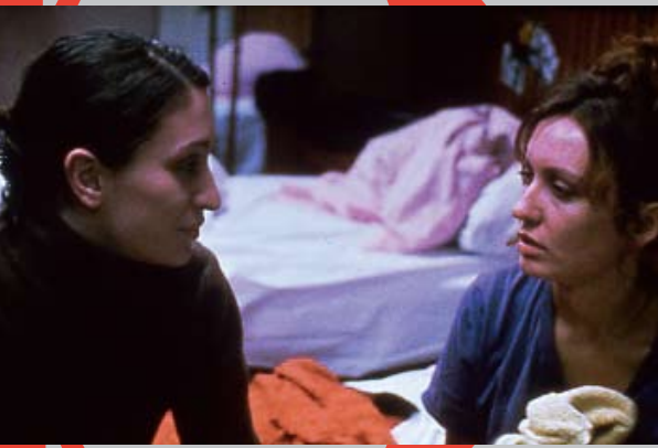
La vie sauve, 1997