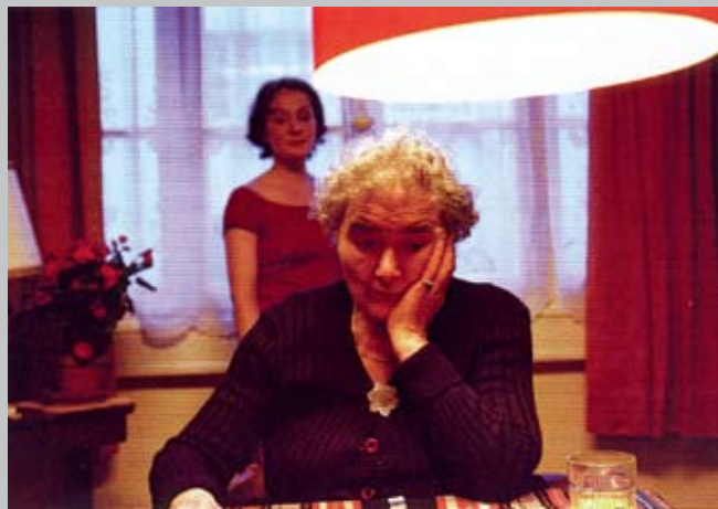
Chanson entre deux, 2001