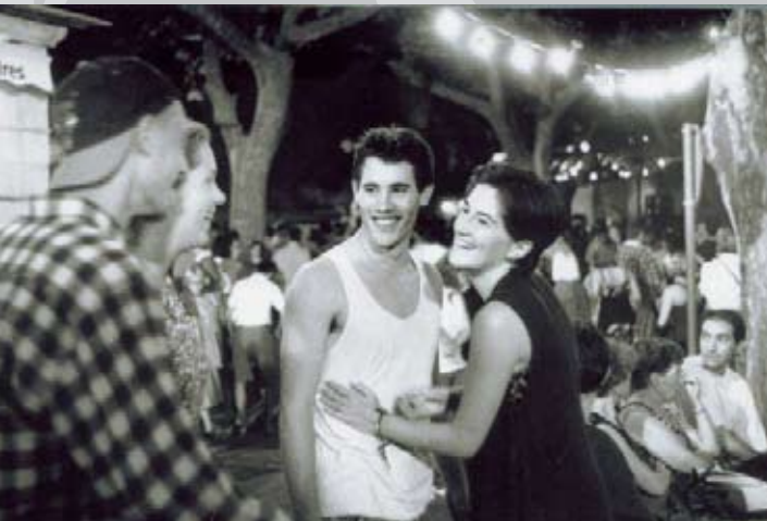
Jeux de plage, 1995

Enrichir la connaissance d'une œuvre, ouvrir le champ critique, alimenter les pistes de programmation suppose que nous vous informions régulièrement, au moyen de ce bulletin, en vous offrant, au besoin, la possibilité de voir les films. Il s'agira, plutôt que de prétendre à une exhaustivité, de mettre l'accent sur les films et les itinéraires singuliers qui font que le cinéma se renouvelle et nous interroge. À la fausse évidence que nous évoquions plus haut, nous en opposerons une autre : un film est un film, indépendamment de toute appréciation de durée ou de genre.